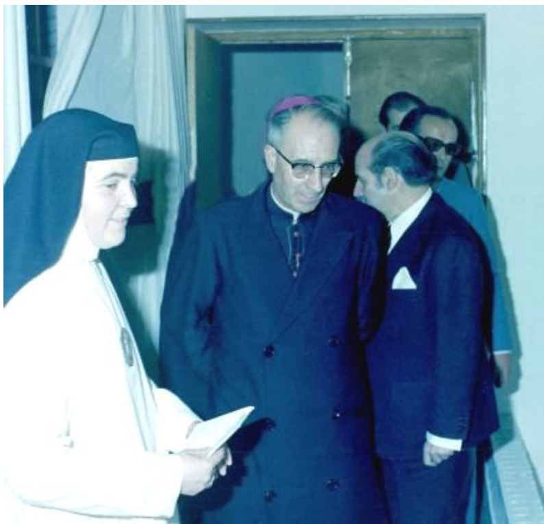
Momentos en los que el Sr. Obispo visita distintas dependencias del monasterio

Pero las obras estaban retrasadas y por tanto el monasterio no estaba preparado para acoger a la Comunidad. No obstante, las monjas no quisieron dejar pasar la fecha aniversario y con gran esfuerzo y trabajo, tomando conciencia del