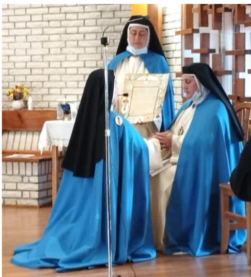
Sor María Teresa emitiendo su Consagración al Señor en manos de Madre Abadesa

desbordante y contagiosa debe ser siempre un signo luminoso y creíble para el mundo y el hombre actual.